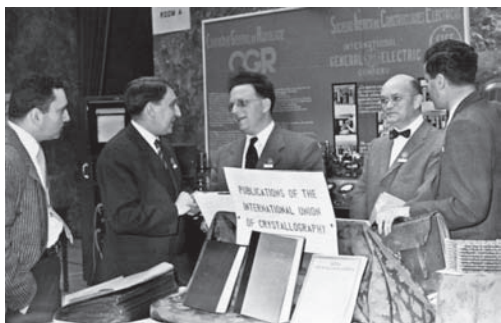
Figura 19. La primera reunión de la IUCr que tuvo lugar en Madrid en 1956.