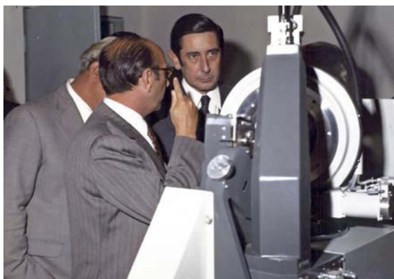
Figura 17. El primer difractor automático de cuatro círculos (PW1100) instalado en España, Madrid, 1973.