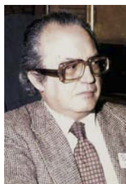
Figura 10. José L. Amorós (1920–2001).