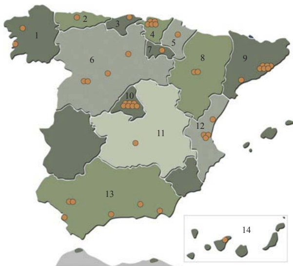
Figura 23. Distribución de grupos de cristalógrafos en España. Los círculos naranja muestran su situación aproximada. Los números sólo significan una referencia regional que se utiliza en los textos siguientes.

Los grupos de cristalógrafos en España se concentran fundamentalmente en las Comunidades Autónomas que se muestran en el gráfico (Figura 23):