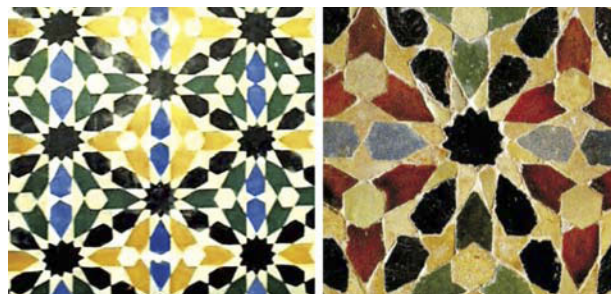
Figura 1. Mosaicos de La Alhambra (siglo XIII).

Recibido: 06/10/2010. Aceptado: 10/11/2010.