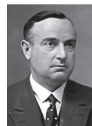
Figura 5. Julio Palacios (1891–1970).

Julio Palacios (Figura 5), discípulo de Blas Cabrera en el Instituto Nacional de Física y Química (Figura 7), Gabriel Martín Cardoso (Figura 6) en el Museo Nacional de Ciencias Naturales de Madrid y Francisco Pardillo en el Departamento de Mineralogía de la Universidad de Barcelona , formaron los primeros grupos españoles de la cristalografía moderna. Luis Rivoir y otros trabajaron con Palacios en la determinación de estructuras de cristales orgánicos e inorgánicos y en la mejora de los métodos de análisis de Fourier. Pardillo creó de forma independiente una escuela de cristalografía en su departamento en la Universidad de Barcelona. Gabriel Martín Cardoso entrenó a Julio Garrido, quién más tarde se incorporaría al grupo de Palacios.