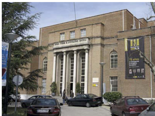
Figura 8. El Rockefeller, hoy Instituto de Química-Física "Rocasolano", uno de los centros de investigación del CSIC.