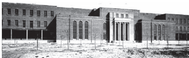
Figura 7. El Instituto Nacional de Física y Química (Madrid, 1932). El Rockefeller fue su apelativo cariñoso debido al hecho de que los fondos usados para su construcción (200.000 $ USA) los donó la Fundación Rockefeller Junior. Véase también Figura 8.