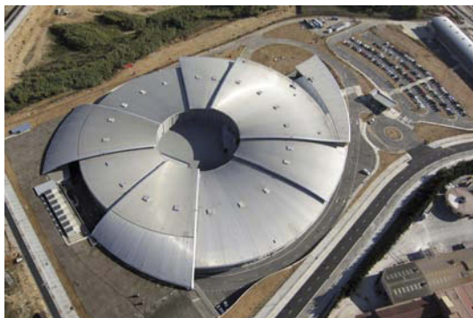
Figura 18. Vista del sincrotrón español ALBA, en 2009.

Program Committee, IPC), estamos igualmente dispuestos a hacer todo lo posible para ofrecer un excelente contenido científico y una atractiva organización para el XXII Congreso y Asamblea General de la IUCr [5] que se celebrará por primera vez en España, y para hacer de Madrid-2011 (casi tras un siglo desde los famosos experimentos de Laue y Bragg) un acontecimiento memorable desde el punto de vista científico y social. Los cristalógrafos estamos convencidos de la importancia de este evento y esperamos que nuestras Instituciones, también. El congreso contará con cuatro conferencias plenarios (tres de ellas ofrecidas por los tres Premios Nobel de Química de 2009), 36 conferencias temáticas y 98 microsimplios, además de un número relevante de reuniones satélite y talleres que se llevarán a cabo en toda España. El programa abarcará las áreas más relevantes de interés, desde el crecimiento de cristales hasta la incidencia de la cristalografía en el arte, e incluirá la biología y biomedicina, ciencia de materiales, química inorgánica, orgánica y de la coordinación, topología, física de la difracción, superficies, y un largo etcétera. Su logotipo se muestra en la Figura 22.