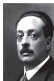
Figura 4. Blas Cabrera (1878–1945).

A principios del siglo XX, los cristalógrafos españoles ya estaban al corriente de los avances internacionales en este campo, y así, muy tempranamente Francisco Pardillo (Figura 3) fue consciente de la importancia de las investigaciones llevadas a cabo por Laue y Bragg, y ya en 1923 informó de estos estudios el Boletín de la Real Sociedad Española de Historia Natural .