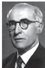
Figura 3. Francisco Pardillo (1884–1955). 1