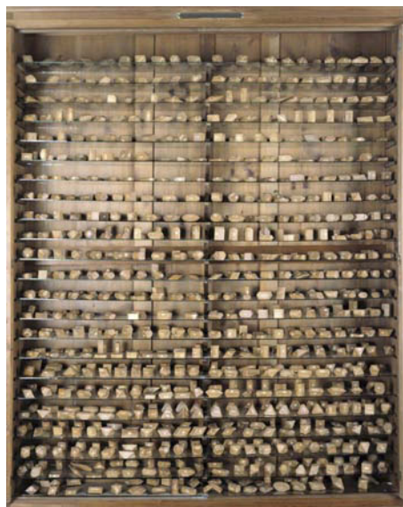
Figura 2. Algunos modelos del abate Häuy.

Algunos cientos de años más tarde, en el siglo XV, seguimos encontrando muchos ejemplos del interés por las estructuras bidimensionales y la simetría, como en el techo de las habitaciones principales de castillos, palacios y edificios especiales, tales como la Universidad de Alcalá o el Castillo de Segovia.