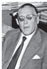
Figura 11. Julio Garrido Marea (1911–1982).