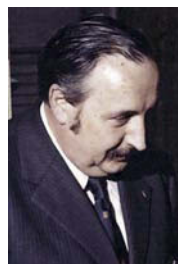
Figura 13. M. Font-Altaba (1922–2005).

Durante las décadas que siguieron a los 1950, los estudiantes eran conscientes de que la cristalografía en España estaba centrada en dos escuelas principales, una en Barcelona en torno a Manuel Font-Altaba (Figura 13, Universidad de Barcelona) y otra en Madrid alrededor de Sagrario Martínez Carrera y Severino García-Blanco (Figuras 14 y 15, Instituto de Química-Física "Rocasolano", CSIC). En aquel Instituto es donde Sagrario Martínez-Carrera incorporó sus experiencias