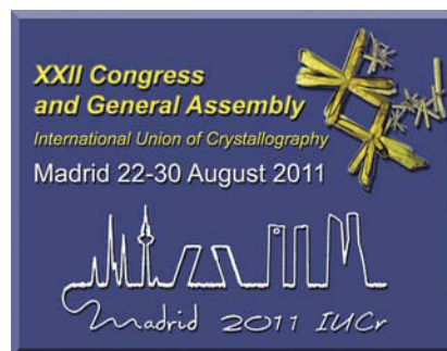
Figura 22. Logotipo oficial del XXII Congreso y Asamblea General de la IUCr.