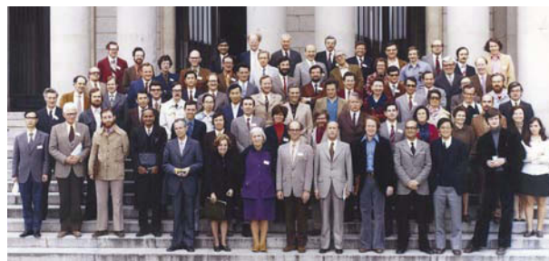
Figura 20. Reunión sobre Dispersión Anómala, celebrada en Madrid en 1974.